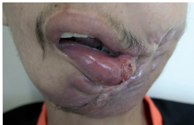
Figura 1 - Aspecto clínico inicial de CEC de boca em paciente jovem

mentoniana e cervical superior. Havia ulceração extensa da lesão, fístula salivar e trismo, com restrição em 80% da abertura bucal. Na oroscopia foram evidenciados lesão úlcero-infiltrativa em região jugal esquerda, rebordo gengival inferior, trígono retromolar e assoalho de boca à esquerda (figuras 1 e 2). Clinicamente não possuía linfonodos cervicais suspeitos. A radiografia panorâmica (figura 3) e a tomografia computadorizada (figura 4) mostraram volumosa lesão expansiva de região mandibular esquerda com reabsorção total do ramo esquerdo, da sínfise mentoniana e da porção proximal do ramo direito, com imagem compatível com gás no interior da massa, sugerindo supuração. Apresentava extensão à fossa infratemporal esquerda, com infiltração do arco zigomático, musculatura da mastigação, esternocleidomastoideo e platisma, região parotídea, palato duro, assoalho da boca até a base da língua, hipofaringe e região supraglótica, com infiltração do osso hioide. Foi realizada biópsia incisional, sob anestesia local, e o exame histopatológico revelou CEC moderadamente diferenciado e invasor.