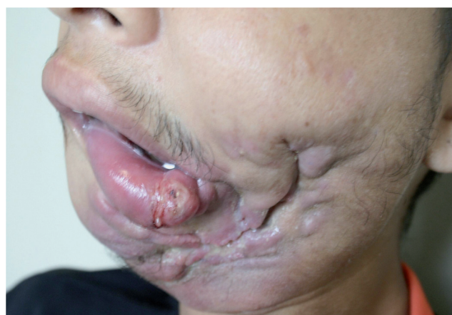
Figura 2 - Vista lateral de CEC de boca em paciente jovem